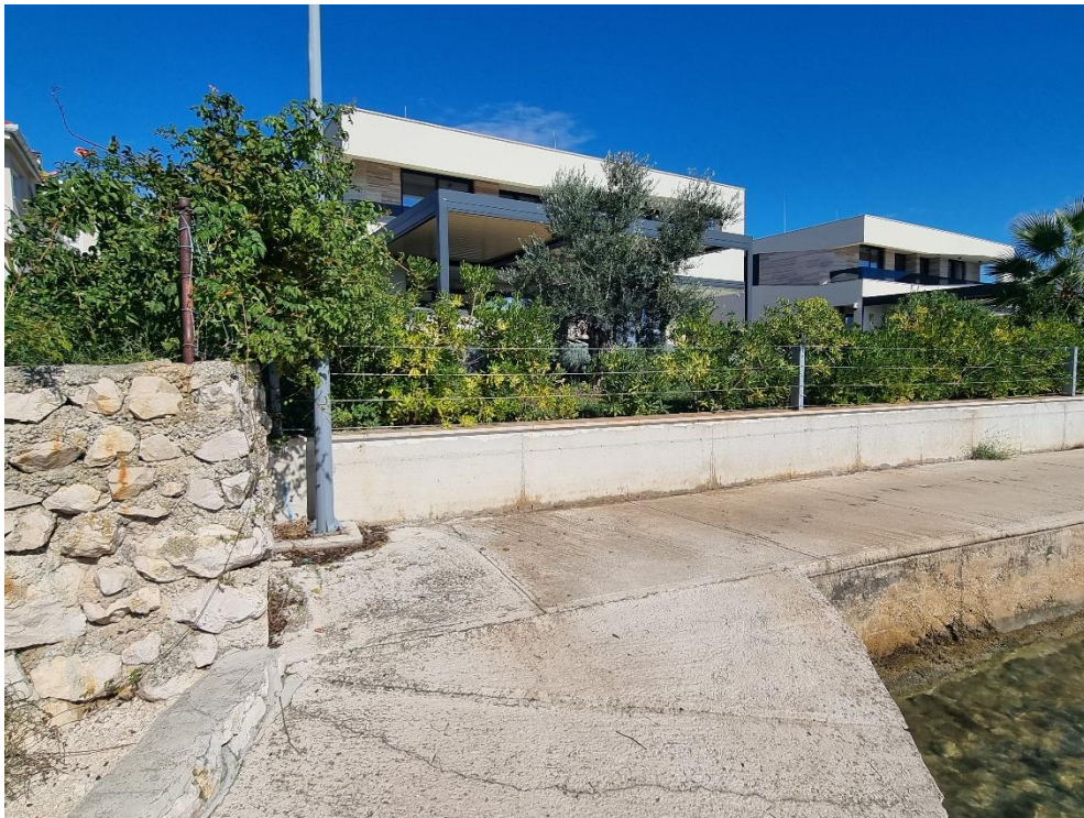
Slika 10., 11. i 12. Od lomne točke 27. do 42.