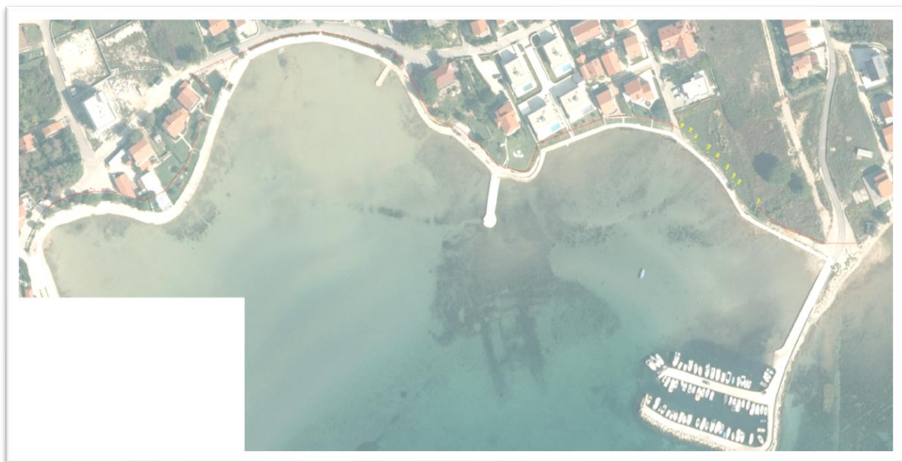
Slike 2., 3. i 4. Od spojne točke M1 do lomne točke 3.